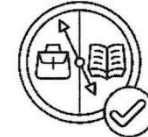
Fort- & Weiterbildungs- möglichkeiten

Schwerbehinderte Bewerber (m/w/d) werden bei ansonsten im Wesentlichen gleicher Eignung bevorzugt berücksichtigt.