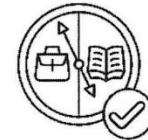
Fort- & Weiterbildungs- möglichkeiten

Schwerbehinderte Bewerber (m/w/d) werden bei ansonsten im Wesentlichen gleicher Eignung bevorzugt berücksichtigt.